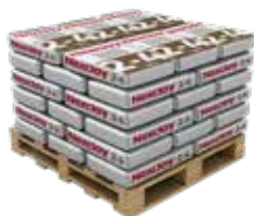
Sacos de 50 litros

Um substrato nunca deve apresentar partículas finas (limos e argilas) em quantidades que possam comprometer a drenagem da cobertura verde. Finalmente um substrato deve garantir de forma uniforme o valor do seu peso quando saturado de água.