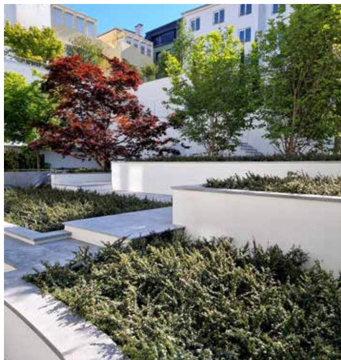
Edifício Emporium, Porto