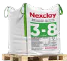
Bigbag de 1,5 m 3