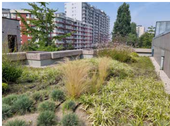
Forum da Maia