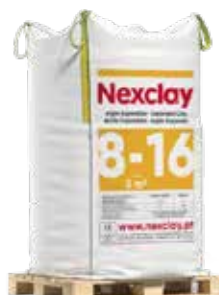
Bigbag de 3,0 m 3